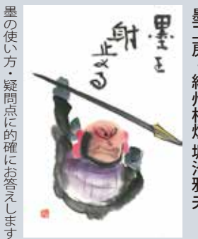
墨の使い方・疑問点的確にお答えします

スニップアート(スポンジはんこ)で年賀状作り 消しゴムを彫るのが苦手な方もハサミを使って簡単に印が作れます。