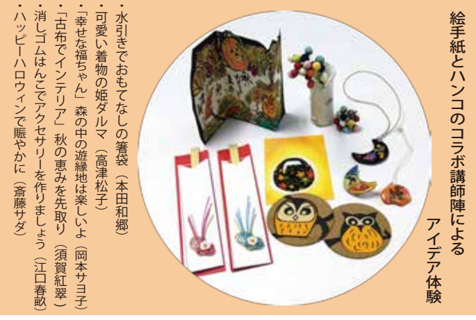
水引きでおもてなしの箸袋(本田和郷) 可愛い着物の姫タルマ(高津松子) 「幸せな福ちゃん」森の中の遊縁地は楽しいよ(岡本サヨ子) 「古布でインテリア」秋の恵みを取ろう(須賀紅翠) 消しゴムはんこでアクセサリーを作りましょう(山口春歌) ・ハッピーハロウィンで賑やかに(斎藤サダ)