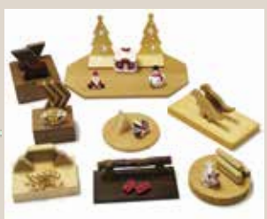
木製ハガキ立て(販売)