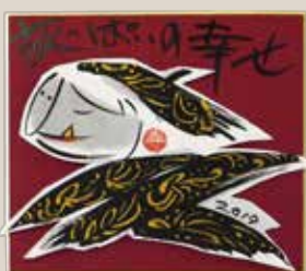
お正月のアイデアミニ飾り