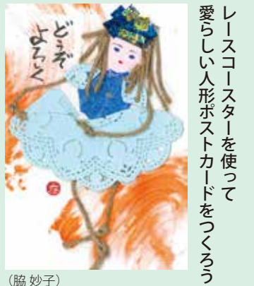
リースコースターを使って 愛らしい人形ポストカードをつくらう (脇 妙子)