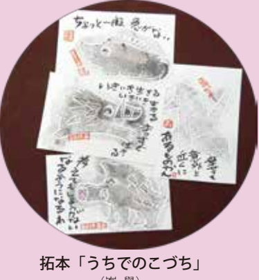
拓本「うちのこぶち」 (峯 譽)