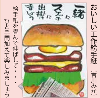
絵手紙を豊んで伸ばして・・・ひと手間加えて楽しみましょう