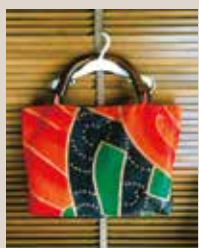
和布絵手紙バッグ(販売)