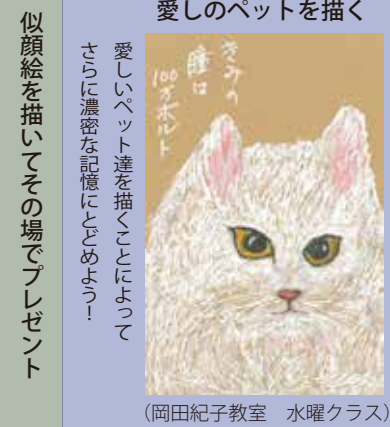
似顔絵を描いてその場でプレゼント (岡田紀子教室 水曜クラス)