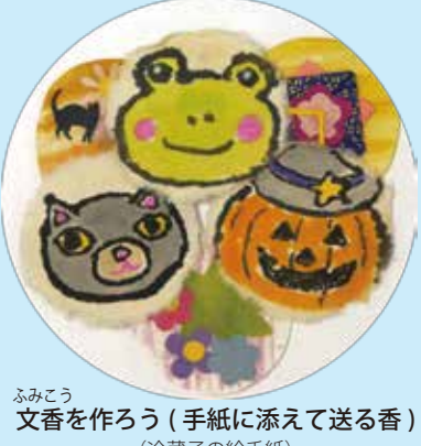
ふみこう 文香を作ろう(手紙に添えて送る香) (冷蔵子の絵手紙)